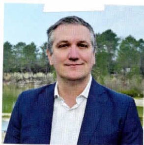
Laurent BARBAN Maire de Léognan

Tous les titres, les textes de ce livret ont été conçus, imaginés, travaillés, écrits par les élus du conseil municipal des Jeunes dans le cadre d'un atelier lecture qui a duré plusieurs semaines. Les dessins ont été aussi réalisés par le CMJ. Ce livret peut vous être transmis en PDF sur simple demande au service Jeunesse de la mairie de Léognan.